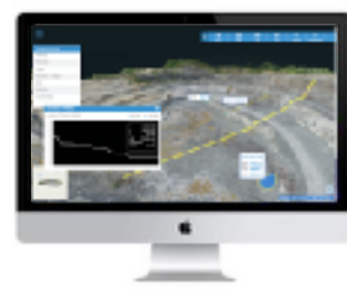
クラウド上にデータ保存 (6ヶ月間)