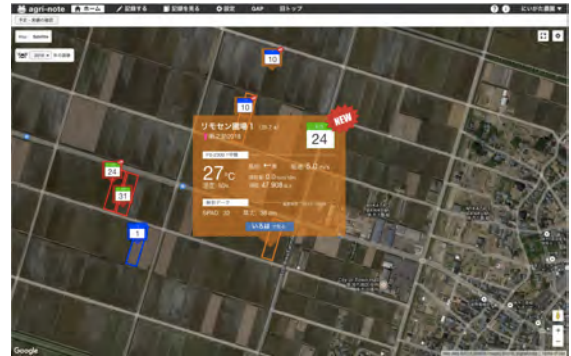
※開発中の画面イメージです。

二つのシステムが連携することにより、いそはで撮影した画像をアグリノート上の圃場と紐付けて管理することが可能になります。アグリノート上では、新規に画像がアップされたことの通知や画像に付されたコメント等の情報を確認することができ、画像を詳細に確認したい場合にはワンクリックでいそはの管理ページに移動することが可能です。