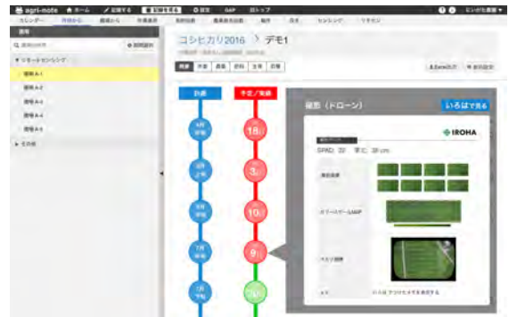
※開発中の画面イメージです。

アグリノートの実績確認機能にいそはの情報が加わります。作業実績や生育状況の記録に空から取得した情報が付き、その時々々の圃場の状態を管理できるようになります。作業と結果を時系列で把握することで、栽培の振り返りがより明確に行えます。